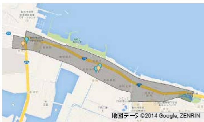
図2－B B地区の銀行・郵便局・市 役所機能の分布