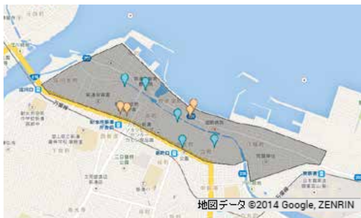
図2－A A地区の銀行・郵便局・市 役所機能の分布