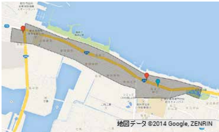
図5－B B地区のコンビニ・スーパーの分布