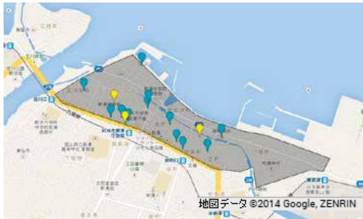
図1－A A地区の 病院・薬局の分布