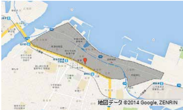
図5－A A地区のコンビニ・スーパーの分布