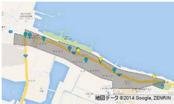
図1－B B地区の病院・薬局の分布